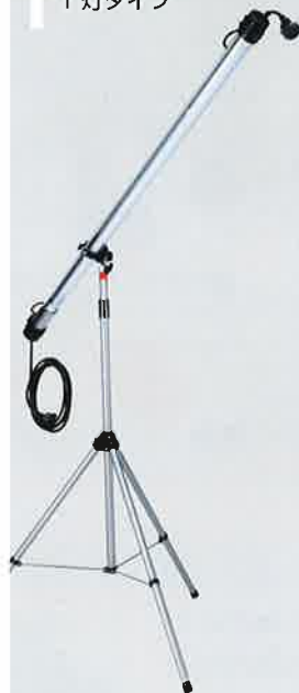
三脚スタンド 1灯タイプ