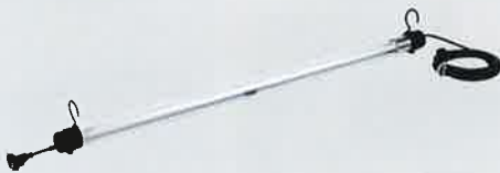
連結型ライトタイプ (吊り下げ用)