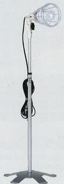
スタンドライト タイプ