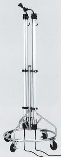
キャスター付スタンド 2灯タイプ